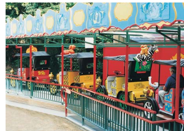
Touro parc - Mâcon (71)