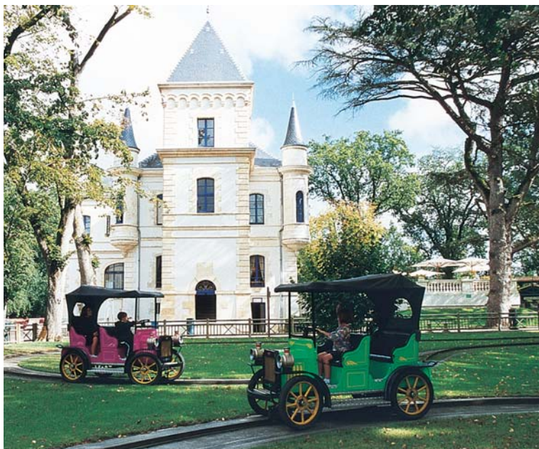
Walibi - Aquitaine (47)