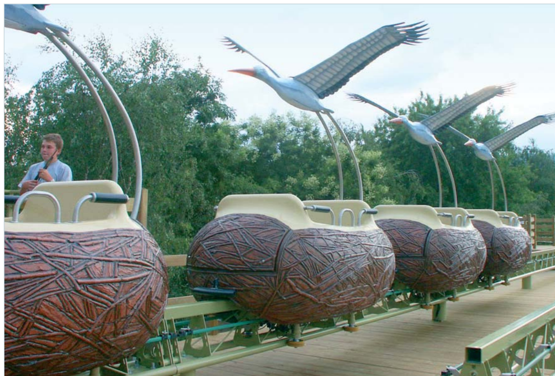
Parc Cigoland - Kintzheim (67)