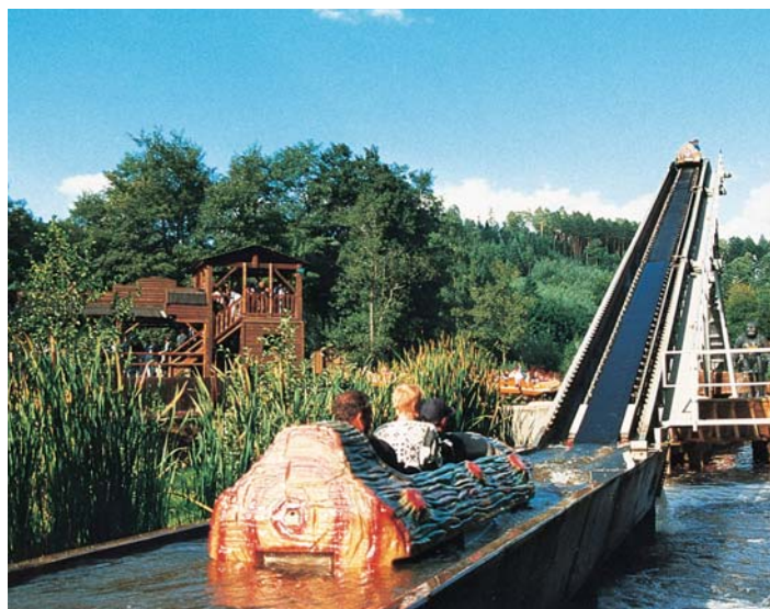
Le Pal (03)