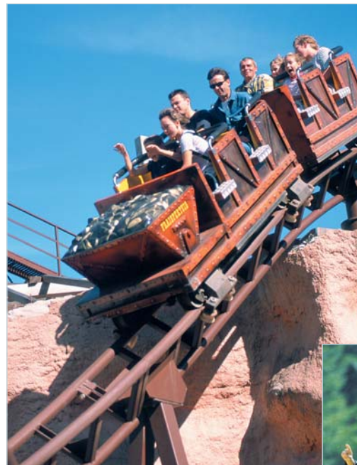
Parc de Fraispertuis /Grand Canyon (88)

Our software allows very realistic simulation, with visualization in 3D, course in virtual animation, speed effects and background music.