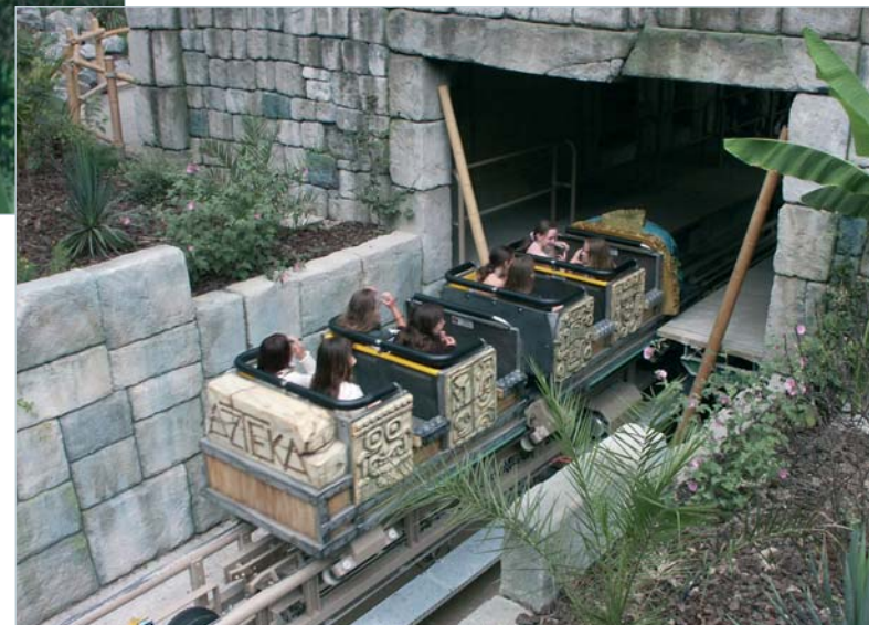
Parc Le Pal. Saint-Pourçain-sur-Besbre (03)