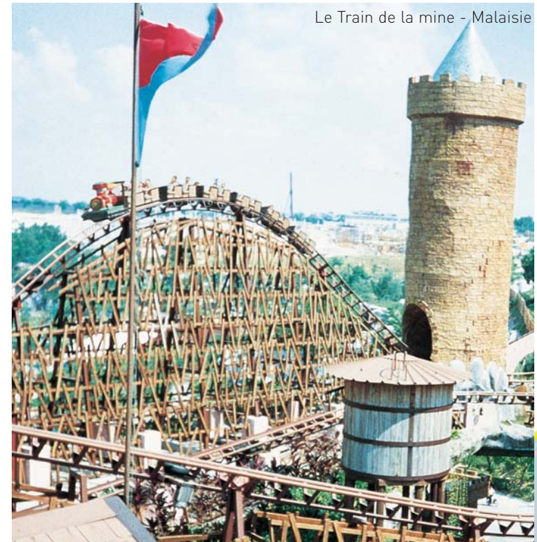
Le Train de la mine - Malaisie

Our software allows very realistic simulation, with vizualization in 3D, course in virtual animation, speed effects and background music.