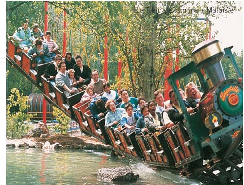
Le Train de la mine - Malaisie